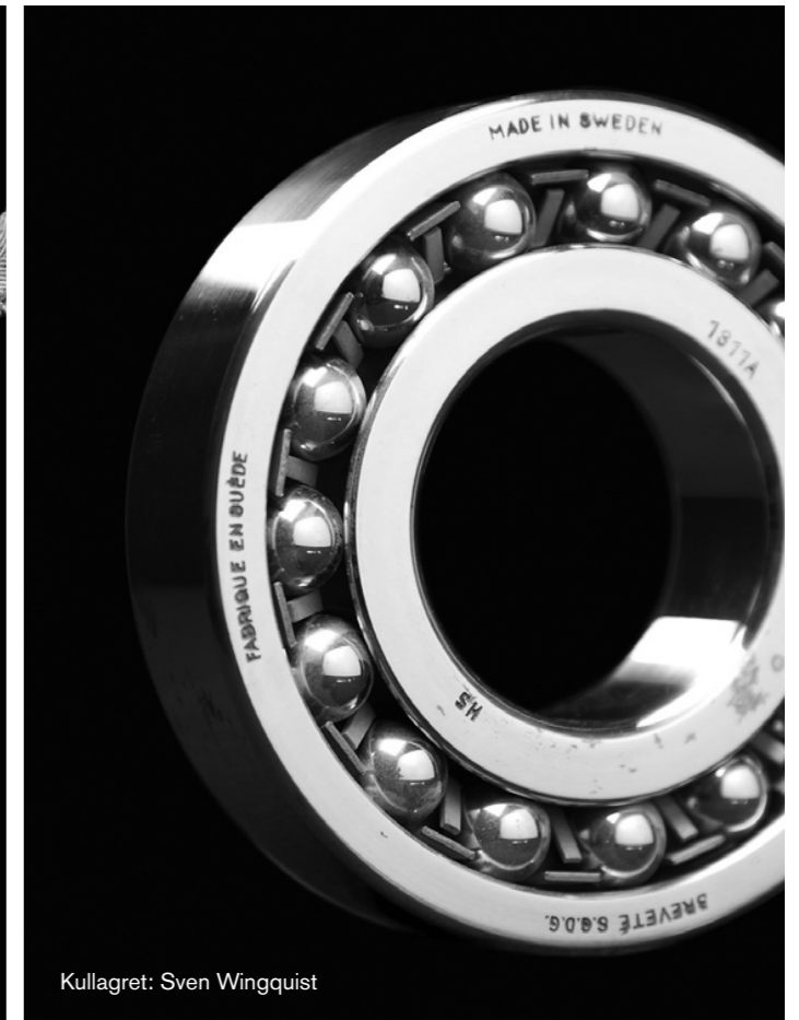
Kullagret: Sven Wingquist

Immateriella rättigheter är ett gemensamt uttryck för rättigheter till patent, varumärke, mönsterskydd/design och copyright/upphovsrätt.