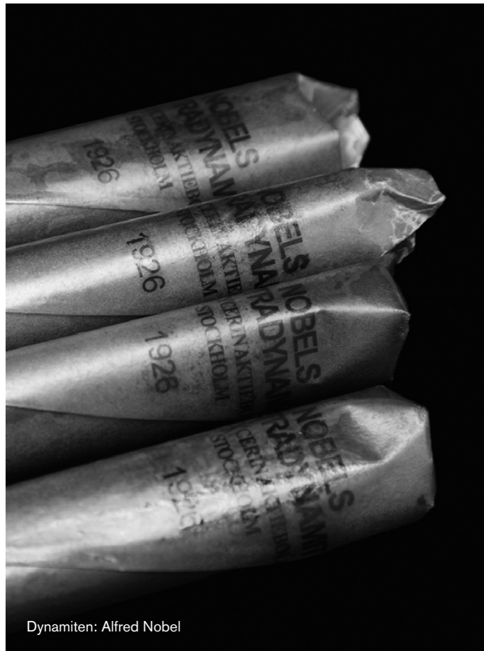
Dynamiten: Alfred Nobel